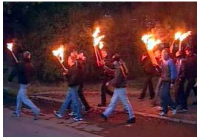
Скинхеды. Факельное шествие в Петербурге.