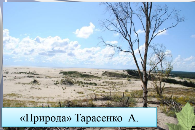
«Природа» Тарасенко А.