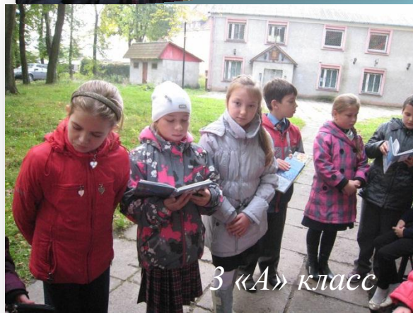
3 «А» класс

Ученики 3 «А» класса недавно побывали на экскурсии в нашем осеннем парке. Красный, жёлтый, бурый, золотистый, пятнистый ложится на землю лист. Укрывают её тёплым лоскутным одеялом. Под ногами шуршит ковёр листопада. Именно такую живописную картину увидели ребята. Целью экскурсии было показать красоту осенних красок и разнообразие деревьев. Здесь, в парке, на свежем воздухе читали стихи об осени, поиграли в игры «Узнай дерево по листочку», «Прятки», собрали листья для гербария, покатались на качелях. Ученики остались очень довольны экскурсией, надышались свежим воздухом, полюбовались яркими осенними красками, пёстрым нарядом деревьев. Хорошо в осеннем цветистом парке! Ребятам долго не хотелось покидать его, расставаться со сказочной красотой.